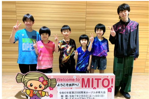
富岡・茂田し・吉野・茂田は・茂田こ・真志コーチ