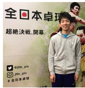
全日本ジュニア出場