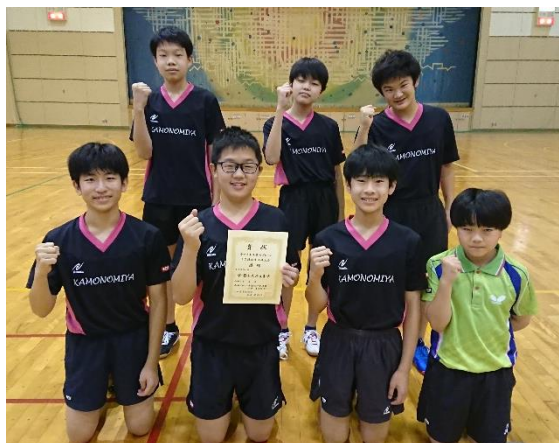
鴨宮中学男子チーム

女子団体 鴨宮中学が優勝しました。今年のメンバーは中学生から始めた人も多くいますが真面目な努力家が多く着実に上達しています。県大会は12月末から行なわれます。