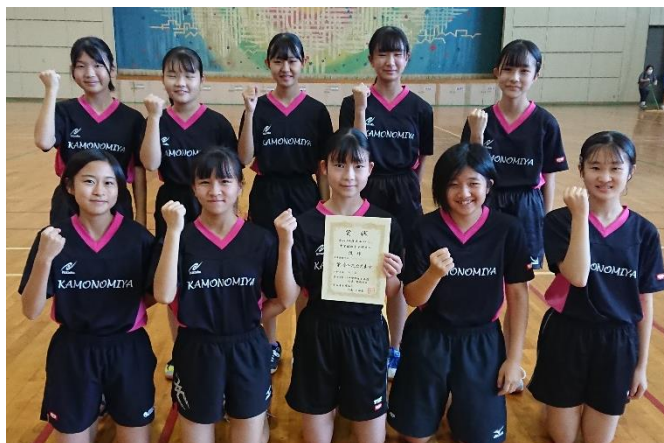
鴨宮中学女子チーム