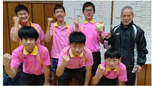
たなかクラブチーム

土日2日間の大会に土曜日午前3時出発で長野まで行ってきました。初日の午後の決勝トーナメントあたりから徐々に良い試合が出来るようになり2日とも準優勝。決勝は初日・2日とも東京の宮上中でした。初日は0-3で負けましたが2日目は2-3で5番もフルセットの大接戦でした。選手たちは試合ごとに相手の技術に対応できるようになり強くなっていくのが良く分かりました。