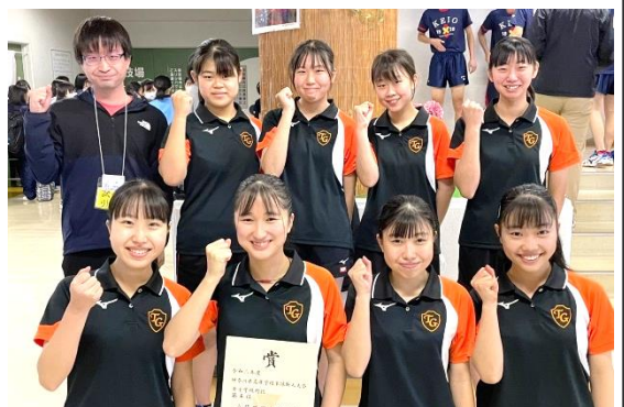
5位入賞の立花学園女子卓球部