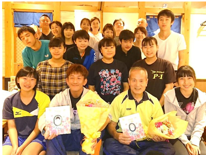
出席した選手と保護者、監督、コーチ (川口コーチは都合により欠席)

3年生11名のお別れ会を近くの居酒屋で保護者と一緒に行いました。(都合により欠席者2名) 選手から、試合で勝ってうれしかったこと、負けて悔しかったこと、上手くてきなくて苦しかったこと、友達とのことや、感謝の言葉も頂きました。保護者からも子供と共に充実した日々だったなどの言葉もありました。会が盛り上がり、予定していた3時間はあっという間に過ぎて、名残惜しさから店の外で30分以上立ち話が続いていました。皆さん全員が高校でも卓球を続けるということです。今後はたなかクラブでの経験を生かして頑張ってください。